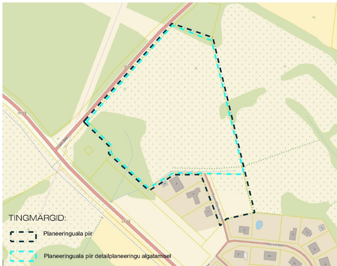
Joonis 1. Planeeringuala piir algatamisel ja planeeringuala piir nüüd.